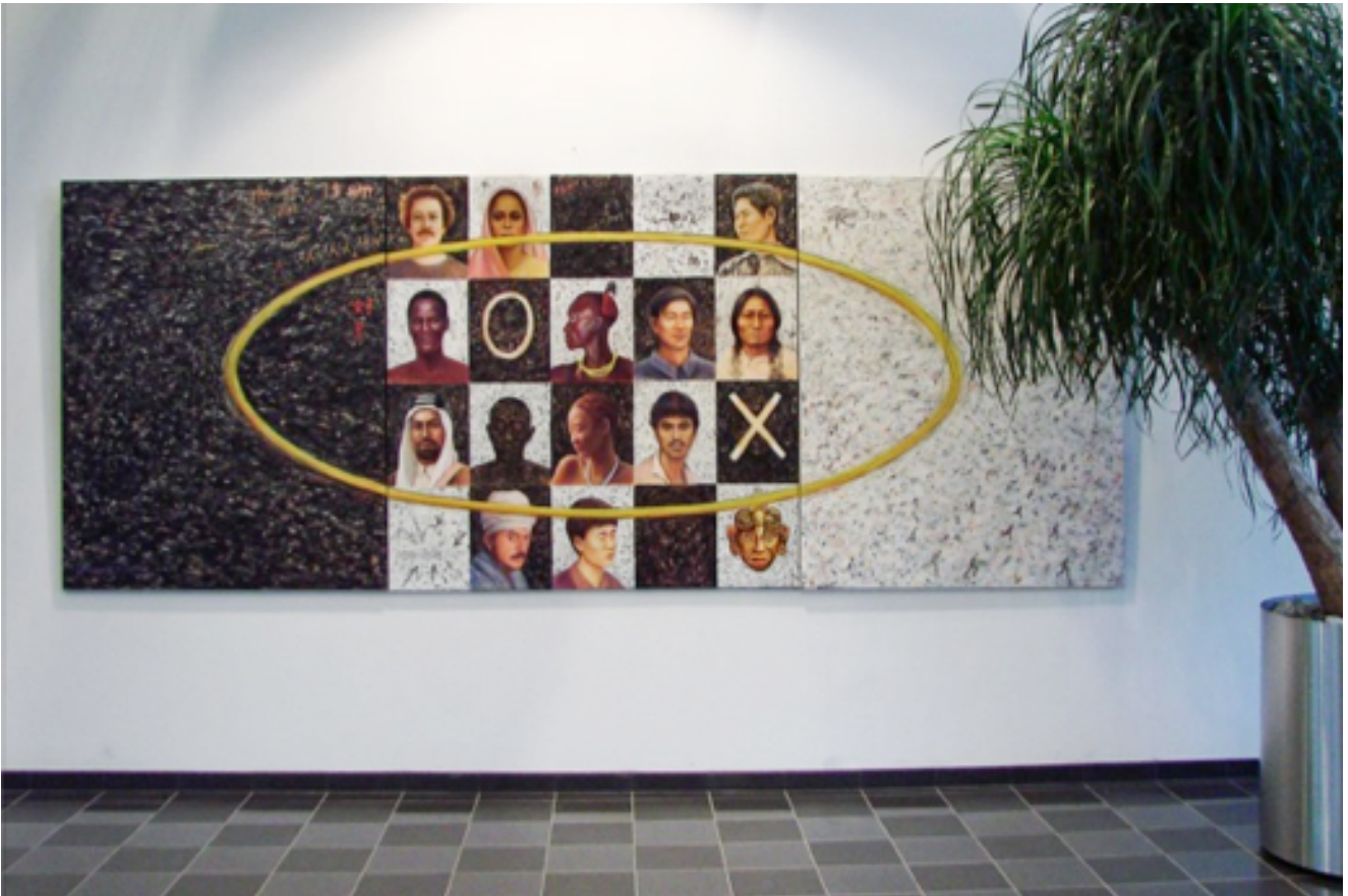
Joke van den Berg, 'Colourblind' uit de serie Black & White, 1991, acryl op linnen, 420 x 150 cm